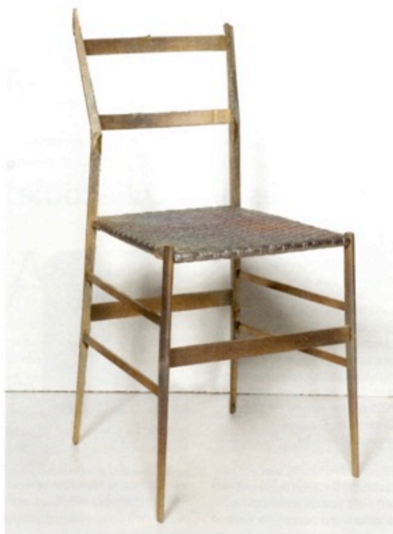
Marion Duclos, à voir à The Impermanent Collection. © de l'artiste