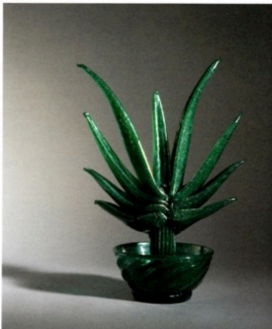
Napoleone Martinuzzi, Succulent plant , Venini, exposée à la Biennale de Venise en 1930.

Dans la section Modern, la Galerie Flore présente non seulement des œuvres d'art, mais également du design. La galerie propose ainsi de nouvelles œuvres du designer français Hervé Van der Straeten, notamment des luminaires, des tables basses et une armoire laquée japonaise. Elle associe ces œuvres avec des pièces des XVIIIe et XIXe siècles, créant ainsi un dialogue sensuel entre les époques. www.galerieflore.com